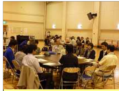
グループ討議の様子