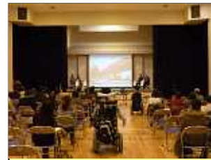
3月14日「ふるさとをください」映画上映会